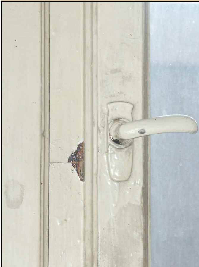
původní secesní poloviční klička se štítkem