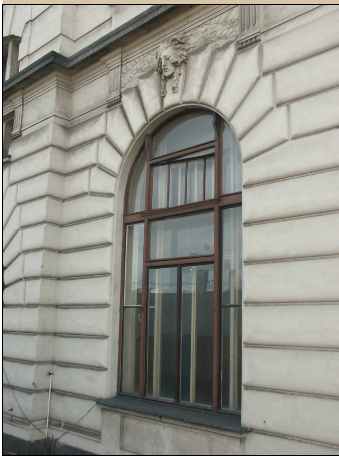
pohled na okno z exteriéru