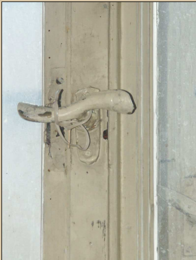
klička se štítkem, původní secesní